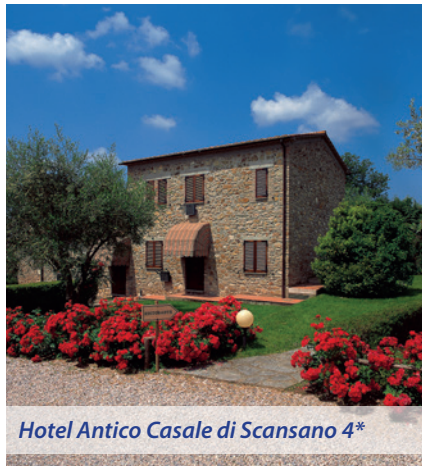
Hotel Antico Casale di Scansano 4*