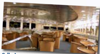
Salle de spectacle / théâtre