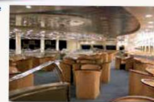
Salle de spectacle / théâtre